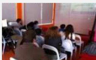
Navegar em segurança

Foram dadas a conhecer algumas das atividades que iremos desenvolver ao longo do ano para alertarmos a comunidade da importância da segurança e da prevenção no dia a dia.